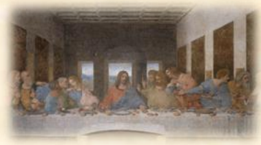
Son Akşam Yemeği