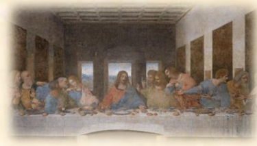
Son Akşam Yemeği